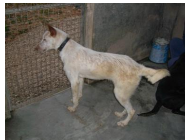
Scubidu lebt heute glücklich bei seiner neuen Familie in Belgien

Die kleine Podenco-Mix Hündin Lisa konnte man nicht anfassen, sie hatte so sehr Angst. Auf der Haut über dem Beckenknochen rechts hatte sie eine verkrustete Stelle. Es stellte sich heraus, dass sie einen Unfall gehabt haben muss. Wir wissen natürlich nicht ob es von einem Autounfall oder einem starken Schlag mit einer Eisenstange herrührt. Der Beckenknochen war gebrochen, und da unbehandelt, übereinander zusammengewachsen.