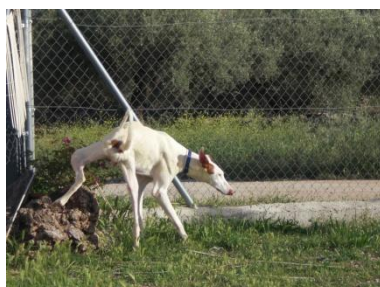
Don Qui stolz beim 1. Markieren nach Bein OP Anfang Juni 08