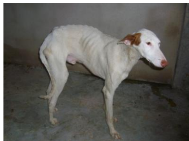
Don Quijote in der Perrera am 16.03.2008