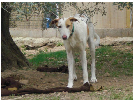
Megan, die grosse, ruhige Hündin

Lisa hat sich sehr gut entwickelt, ist sehr verspielt und lausbüchisch und im Umgang mit ihr bekannten Personen richtig verschmust.