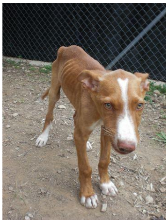
Der Welpe Marron