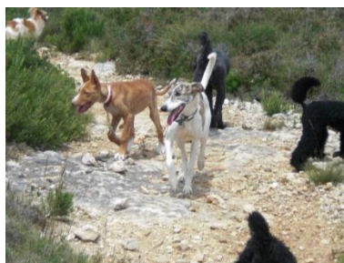
Marron auf Spaziergang in den Bergen Mitte Juli 2008