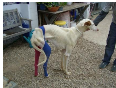
Don Quijote nach seiner Bein OP 18.04.2008

Als ich an einem Sonntagnachmittag im März 2008 in der Perrera Terres del Ebre dieses Häufchen Elend von Hund sah, war ohne dass ich es damals ahnte, der Grundstein für die Podenco-Help-Filato gelegt.