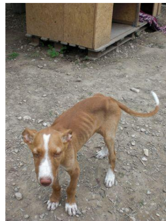
Abgemagert und teilnahmslos

Und als vorläufig letzter und jüngster Neuzugang brachte man mir im Mai 2008 den Podenco-Welpen „Marron“, der damals ca. 12 Wochen alt war.