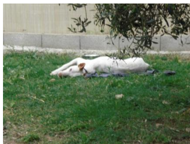
Scubidu bei der Siesta