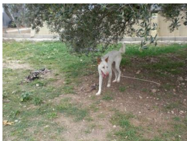
Scubidu wartet auf Lisa zum Spielen