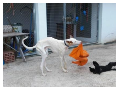
Don Qui beim Beutespiel mit einer geklauten Decke 10.6.08

Ich brachte es nicht übers Herz, nur ihn aus der Perrera rauszuholen, sondern nahm die 3 anderen ausgewachsenen Podencos und Podenco-Mischlinge auch mit.