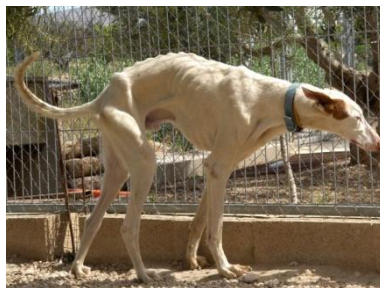
Don Quijote am 2. April 2008