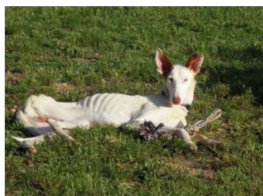
Don Qui entspannt nach einem kurzen Apportierspiel mit Knotenseil 30.5.08

So nach und nach konnten dann die Impfungen, Microchip und Kastration durchgeführt werden.